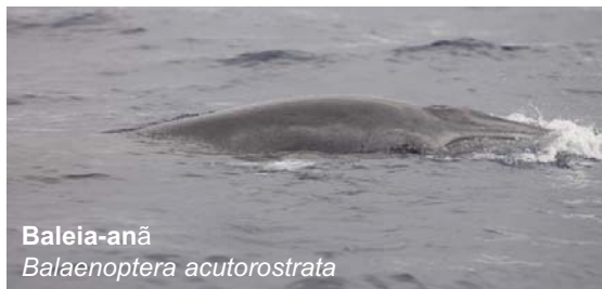
Baleia-anã Balaenoptera acutorostrata

Os cetáceos e as aves aproximam-se dos seres humanos para obter alimento sem muito esforço, como curiosidade ou brincadeira. A interacção dos cetáceos e das aves marinhas com as actividades humanas pode ter consequências negativas para estas espécies.