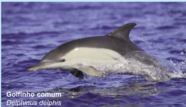
Golfinho comum Delphinus delphis

- Recolher informação sobre qualidade de água, produtividade, disponibilidade de fitoplâncton, zooplâncton e peixes em águas oceânicas.