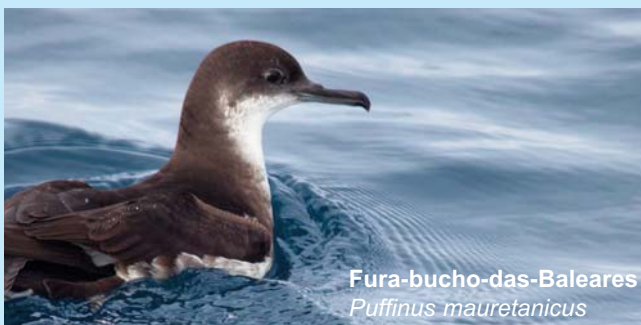
Fura-bucho-das-Baleares Puffinus mauretanicus

- Contribuir com dados de base para a definição de novas áreas marinhas oceânicas em águas Portuguesas no âmbito da rede Natura 2000.